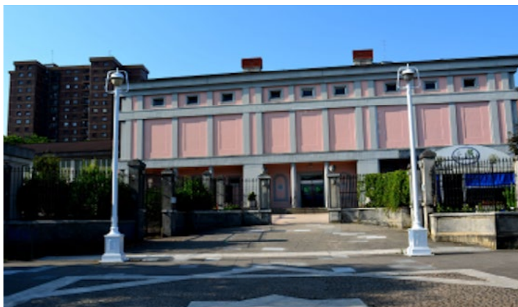
> Es la conclusión de un informe para determinar el origen de las filtraciones.

En La Benedicta, el informe señala que las filtraciones se originan principalmente en los tres lucernarios existentes. Además, se ha detectado la necesidad de impermeabilizar nuevamente la cubierta y de intervenir en los canalones, algunos de los cuales presentan parches y acumulación de vegetación que dificulta la correcta evacuación del agua.