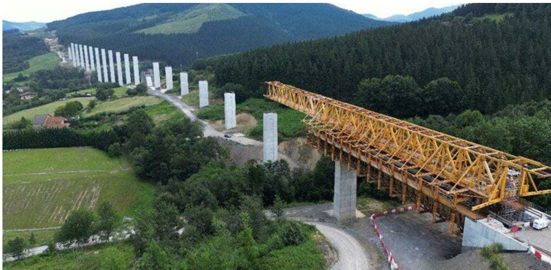
> Son los tramos comprendidos entre Variante Ferroviaria de Burgos y Valle de las Navas, y Manzanos - La Puebla de Arganzón.

Estas actuaciones se suman al de Pancorbo - Ameyugo, actualmente en construcción