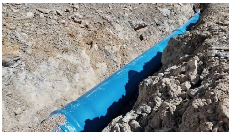
> El acuerdo está enmarcado en el Plan Director 2016-2026.