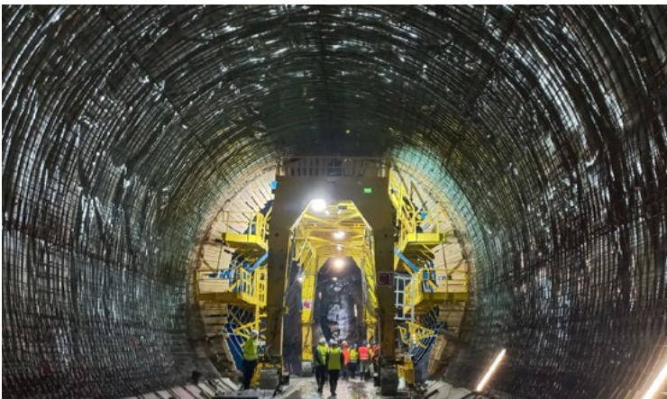
> Tiene un coste de 66 millones de euros y una capacidad de 90.000 m3.

El futuro tanque, con una capacidad aproximada de 90.000 metros cúbicos será el mayor de Euskadi y constituirá una infraestructura fundamental para reducir los desbordamientos a la Ría de Bilbao y para optimizar la propia capacidad de tratamiento de la depuradora de Galindo.