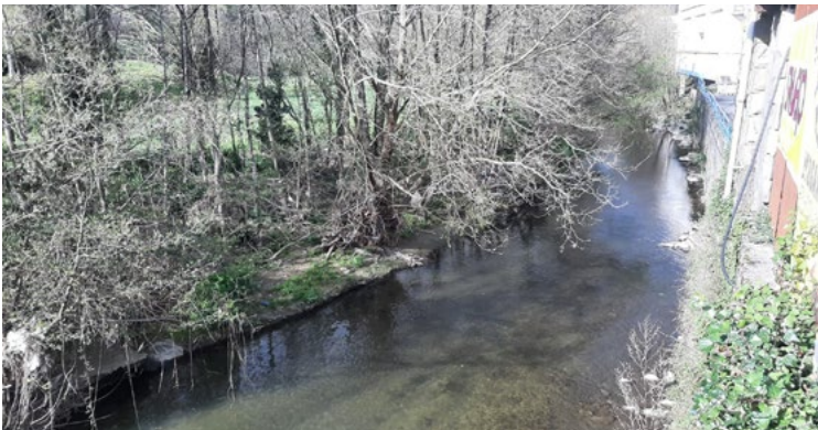
➤ Tiene un plazo de ejecución de 12 meses y se espera que se adjudique a principios de febrero.

La actuación se enmarca en el acuerdo de colaboración firmado entre ambas instituciones en virtud del cual se estableció un programa de trabajo para los próximos cuatro años por importe superior a 6,3 millones de euros a sufragar entre ambas partes.