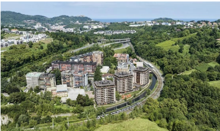
➤ La valoración presupuestaria de este proyecto se estima en 10.427.946 euros.

La intervención incluye la sustitución completa del césped artificial existente por un sistema sin relleno de quinta generación, que destaca por su sostenibilidad, durabilidad, reducción de mantenimiento y ausencia de materiales de relleno susceptibles de generar residuos plásticos.