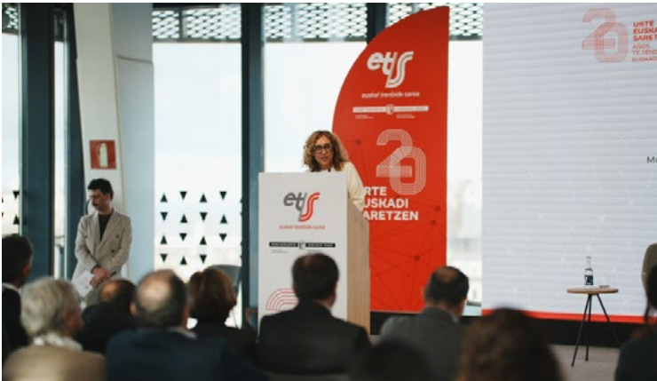
➤ Se ha realizado el anuncio durante el acto de celebración del 20 aniversario del ente público.

Podría entrar en servicio en el segundo semestre de 2026