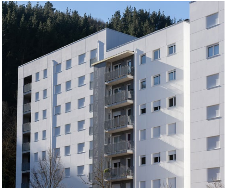
➤ A nivel interanual, el mercado supera las 25.900 operaciones en los últimos doce meses.

Este dinamismo se reparte de manera diferente entre los territorios históricos, aunque todos mantienen niveles elevados de actividad. Bizkaia concentra el