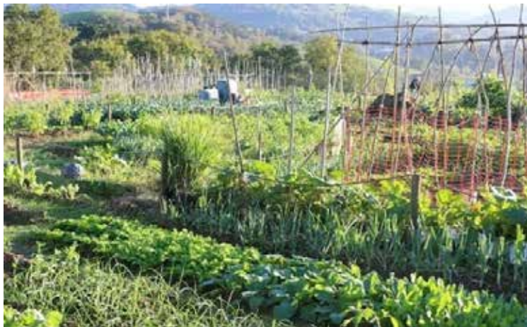
➤ Se procederá la cubrición de la zona contaminada y al acondicionamiento del área.

bado el proyecto de ejecución de sustitución de carpintería exterior en CEIP Katalin Erauso HLHI. Concretamente, se sustituirán las ventanas de todas las aulas y despachos, y la puerta