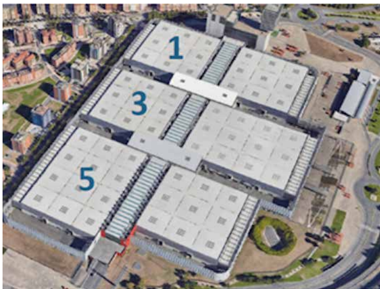
➤ Con una inversión de 4,3 millones de euros, se ubicará en las cubiertas del BEC.

Así, está previsto que la nueva instalación genere alrededor de 7.200 MWh/año, cubriendo una tercera parte del consumo del hospital. Para ello, contará con tecnología de módulos bifacial,