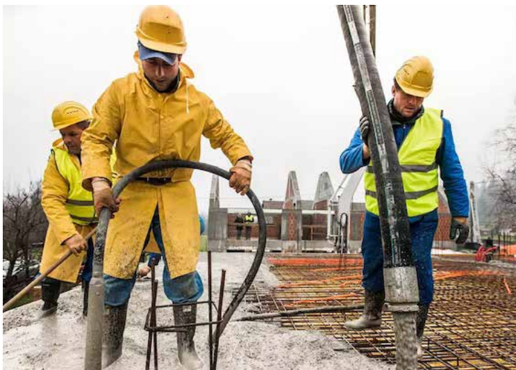
➤ Concretamento, se alcanzó los 1.612.491 millones de euros frente a 1.676.630.

Por tipología, la licitación en ingeniería civil sumó el 61,3% de las operaciones, con un descenso interanual de -12,2%. La licitación en edificación representó un 46,7% y aumentó un 7,9% con respecto al año anterior.