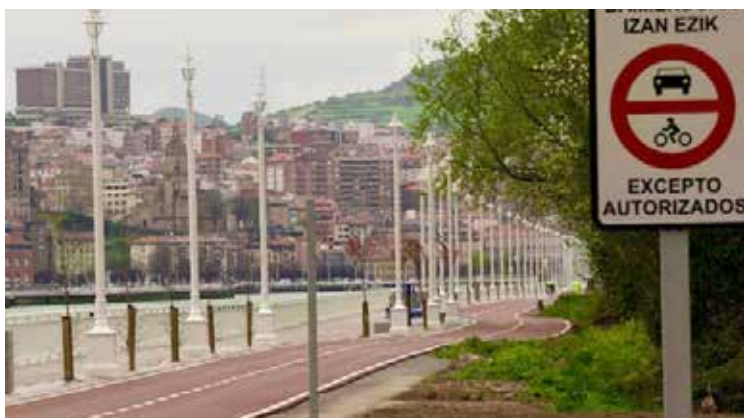
> imagen de la primera fase del Bulevar de la ría.

El trazado previsto, que se desarrollará íntegramente en túnel, deberá pasar bajo el río Ibaizabal, por lo que será necesario que discorra a la profundidad suficiente para evitar la afección al mismo.