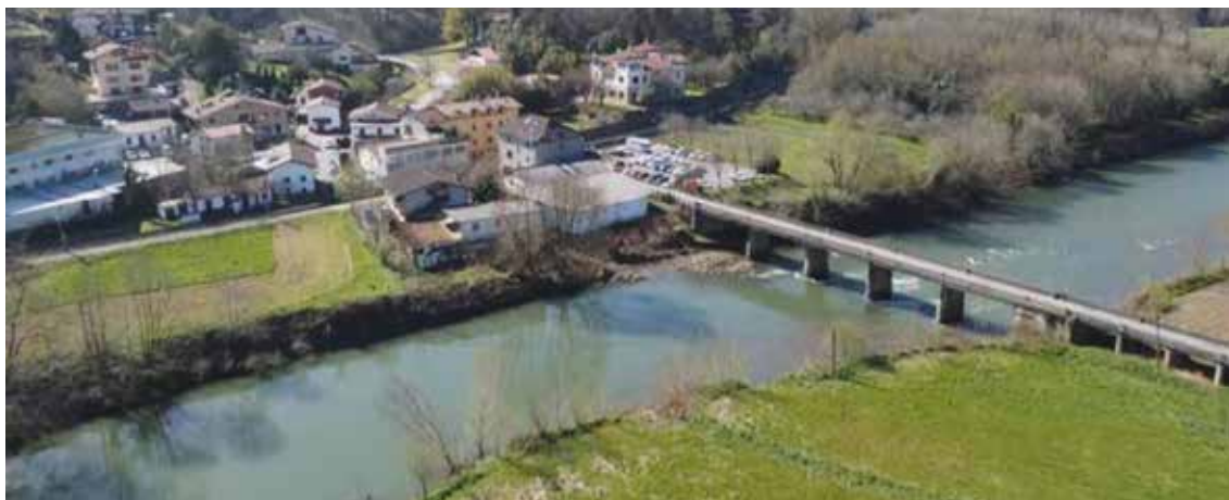
➤ Imagen del puente de Txokoalde, donde se acometerán labores de rehabilitación como paso previo a la ejecución del túnel de Aginaga.

La obra acortará el recorrido actual y duplicará las frecuencias entre Zarauz y Usurbil