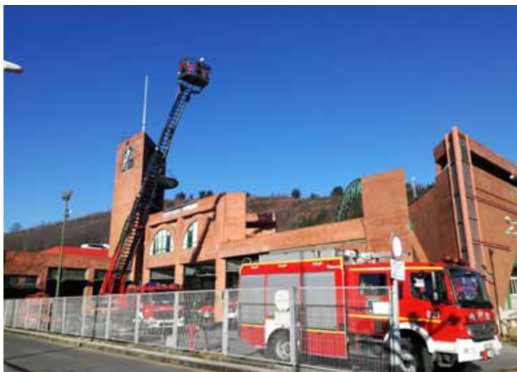
➤ La empresa Indenort PV, S.L.U.-Proviser Ibérica tendrá un plazo de ejecución de veinte meses.

Junto con ello, además, la rehabilitación y reforma integral