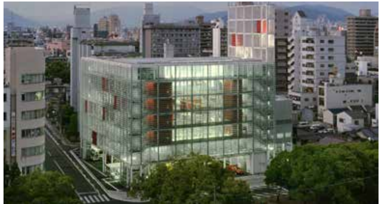
> Imagen de la estación de bomberos de Hiroshima, uno de los trabajos representativos del arquitecto.

Los edificios cívicos que cumplen funciones específicas también afirman el propósito y la seguridad públicos. Por ejemplo, la estación de bomberos de Hiroshima Nishi (Hiroshima, Japón, 2000) parece completamente transparente, con su fachada de lamas de cristal y sus paredes interiores de cristal.