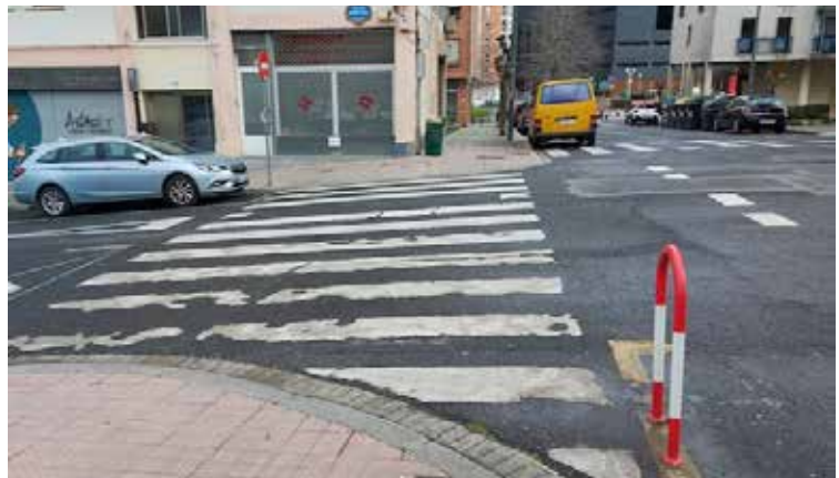
> Las actuaciones, que salen ahora a licitación, tienen un plazo de ejecución de siete meses.

La pavimentación se hará con baldosa tipo Bilbao de color gris y el remate de las aceras se ejecutará con bordillo de granito. En los pasos de peatones se colocará baldosa direccional y táctil de botones, de color rojo. Esa misma baldosa, en color amarillo, se dispondrá en la parada de autobús.