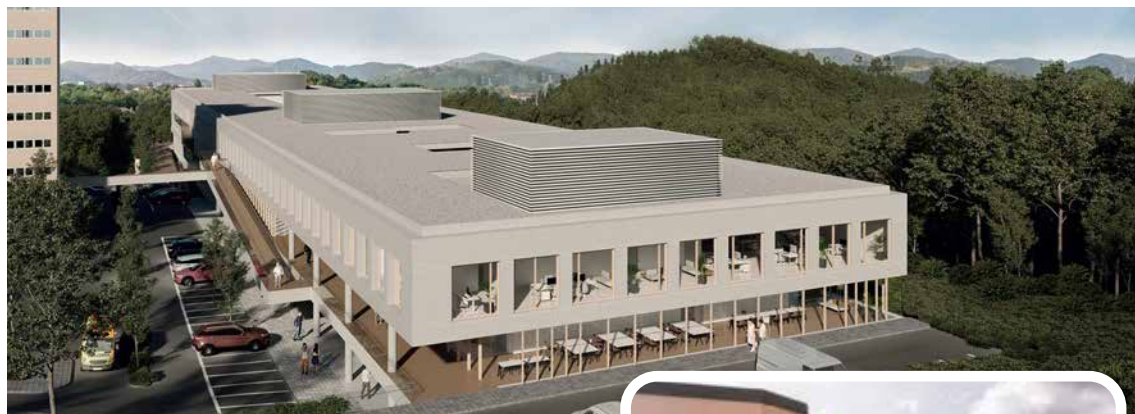
➤ Arriba, infografía del nuevo edificio de consultas externas del Hospital Universitario Galdakao - Usansolo. A la derecha, el del Hospital Universitario Basurto.

Ambas instalaciones sanitarias podrían entrar en servicio antes de que finalice 2027