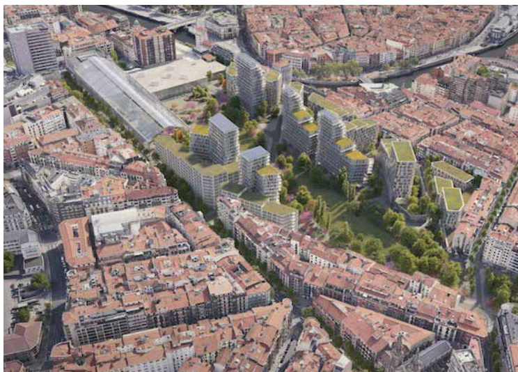
➤ La infografía del proyecto ganador muestra el futuro parque central junto a la bóveda histórica.

En este sentido, se potenciará la continuidad del futuro parque central, hasta su integración en