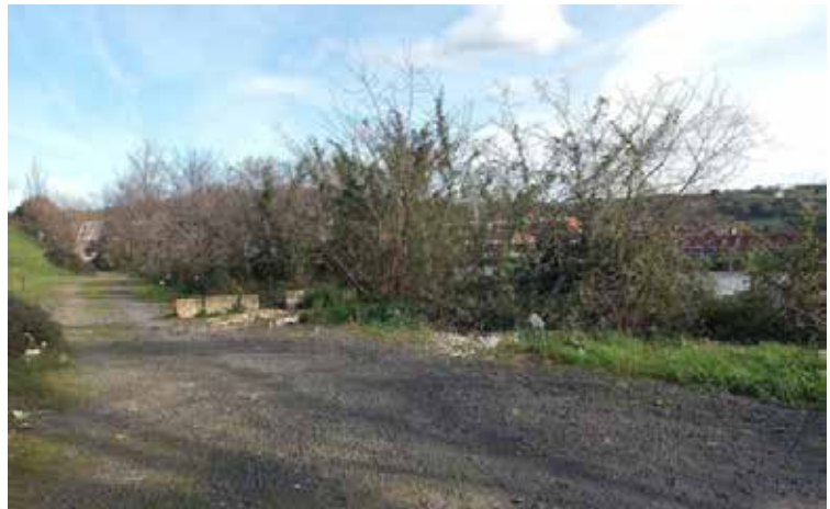
> La mayoría de los residuos depositados en la vía pública son sacos con materiales de obra.

En esta ocasión, el área de Servicios calcula que han sido retirados de la vía pública entre 8 y 10 toneladas de residuos repartidos por zonas como Ibarzaharra, el Parque Empresarial Sestao Bai, Simondrogas, Marismas de Galindo y cerca de la Ría.