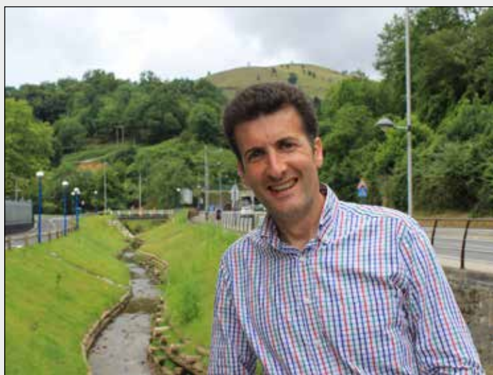
Barakaldo recuperará los ríos Castaño y Galindo > P. 5