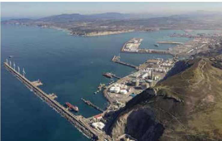
➤ La licitación salió a finales de enero, con el objetivo de captar nuevos tráfico.

Junto a ello, también se ha licitado la mejora de la pista deportiva, adaptada para la práctica de fútbol, baloncesto. Tal y como se recoge en el informe, el suelo es de hormigón y está considerablemente deteriorado, con grietas notables. La rehabilitación y adaptación de la pista y la colocación de un pavimento deportivo adecuado rondará los 465.000 euros.