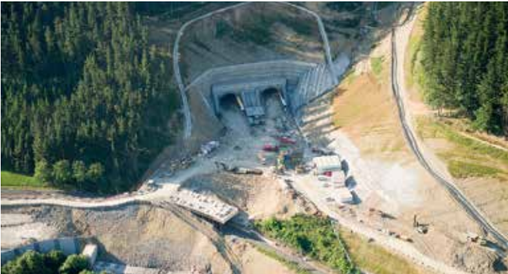
► El depósito de sobrante ha recibido excedentes de la variante de Ermua entre 2008 y 2011.

Cabe recordar que entre 2008 y 2011. Este depósito de sobrantes se convirtió en el destino de los excedentes de excavación de tierras de la construcción de la variante de Ermua entre los años 2008 y 2011.