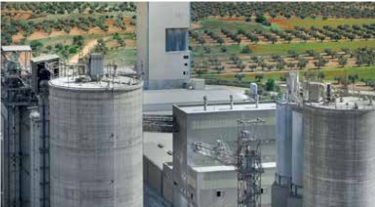
➤ En el acumulado de los cinco primeros meses del año, el consumo se elevó un 1,2%.

Por otra parte, las exportaciones cayeron un 21% en mayo, hasta las 446.254 toneladas, lo que supone una pérdida de 118.699 toneladas. Esta cifra sitúa el acumulado anual en 2.289.234 toneladas, con una caída del 7,1%.