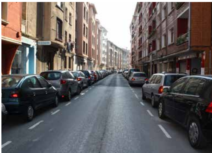
➤ La nueva calle incluirá puntos para la recarga de vehículos eléctricos.

Se trata de una obra que afectará a todos los servicios de la calle, sobre un área de actuación de una superficie de 4.028 metros cuadrados. Además, se pretende potenciar el uso peatonal, eliminando las barreras arquitectónicas existentes mediante la disposición de una plataforma única, e incluyendo superficies amuebladas. Asimismo, en la zona se contará con puntos para la recarga de vehículos eléctricos.