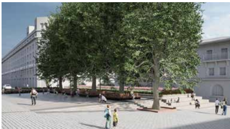
➤ Así se verá la plaza desde la parte alta de Lehendakari Agirre.

El consistorio aprovechará para renovar el pavimento, las instalaciones, la red de drenaje, el riego, etc. En este sentido, AMVISA renovará la red de saneamiento de la zona, con una inversión de 495.406 euros.