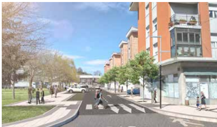
> Infografía sobre el aspecto que mostrará Ogenbarrena tras las obras de reurbanización.

La mejora de la calle Ogenabekoa reforzará la conexión de la trama urbana edificada con el Parque de La Tejera y compatibilizará el uso de los viales rodados y el peatón. Para ello, se construirá un vial convivencial basado en un acabado más homogéneo. Respecto a la calle Ixeranco, se creará un parking exterior en espiga asfaltado con capacidad para 43 nuevas plazas, para lo que se eliminará la acera existente y se acondicionará una nueva con bordillos y acabados.