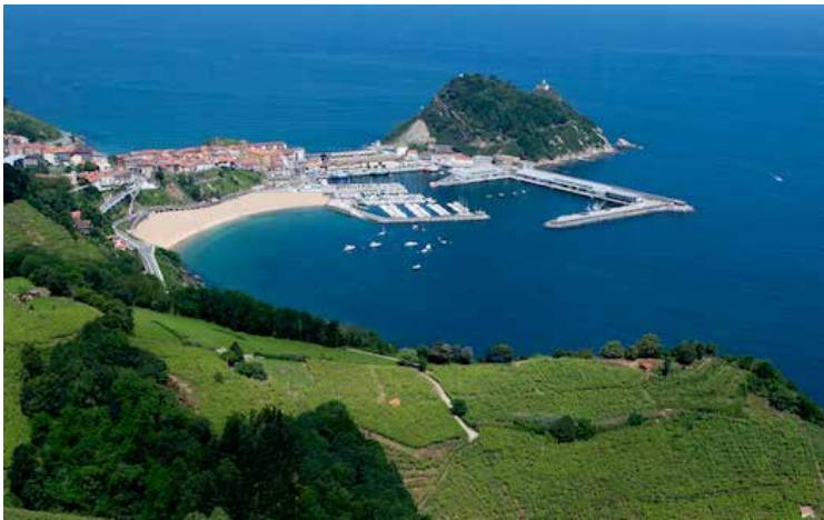
➤ Se trabajará en el dique de abrigo en la zona del talud exterior y del morro.

Las obras comprenden el refuerzo del talud exterior del dique, a lo largo de los tres tramos y del morro del dique, así como el sellado de las juntas existentes a lo largo de todo el espaldón. Para ello, se procederá a la colocación de bloques de hormigón en masa realizados con árido siderúrgico alcanzando altas densidades en la ejecución de los mismos.